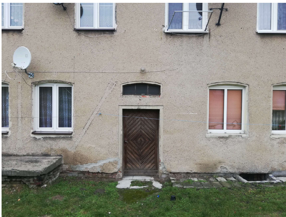
Zdj. nr 6 Drzwi z naświetlem należy odtworzyć wg rysunku historycznego