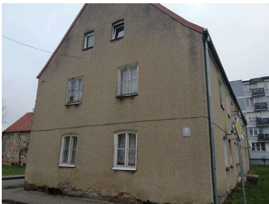
Zdj. nr 4 Widok elewacji zachodniej z oknami drewnianymi przewidzianymi do wymiany