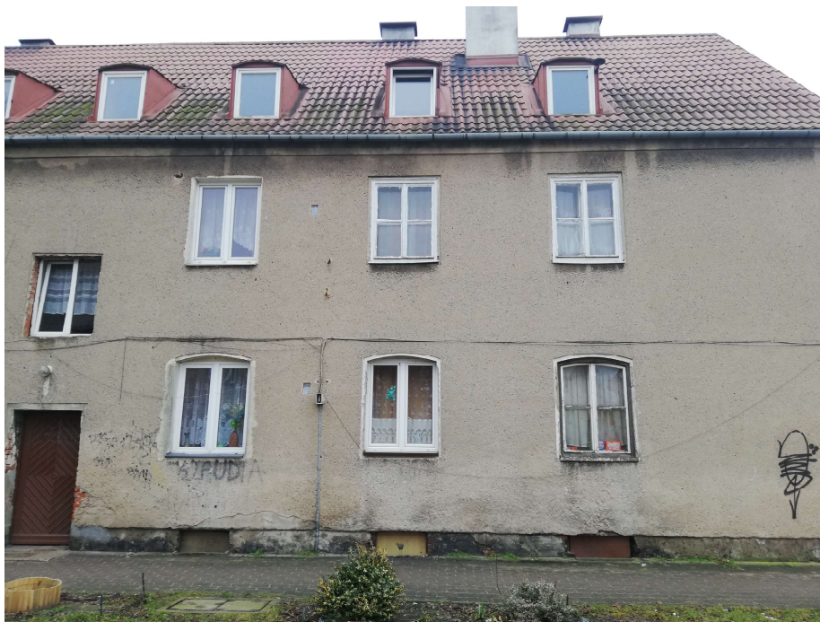
Zdj. nr 5 Fragment elewacji północnej z oknami i drzwiami przewidzianymi do wymiany