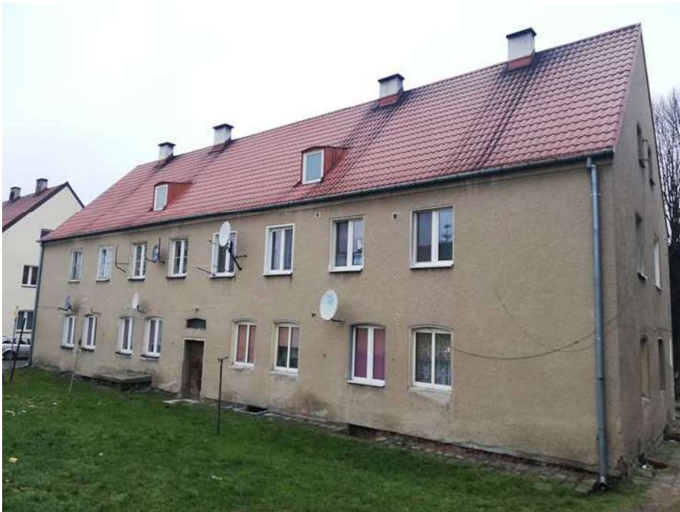
Zdj. nr 2 Widok elewacji południowej