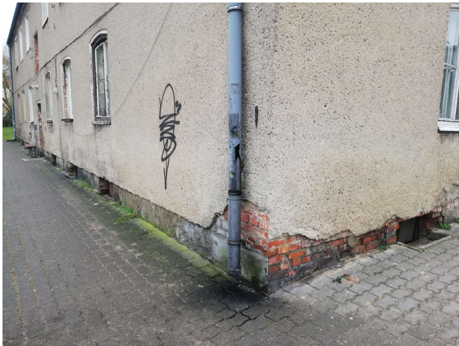
Zdj. nr 8 Zły stan elewacji i okienek piwnicznych w okolicy rury spustowej