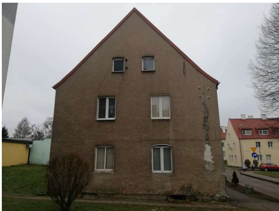
Zdj. nr 3 Widok elewacji wschodniej