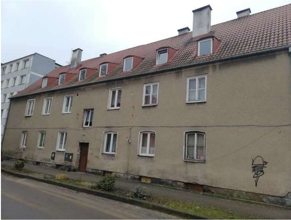
Zdj. nr 1 Widok elewacji północnej