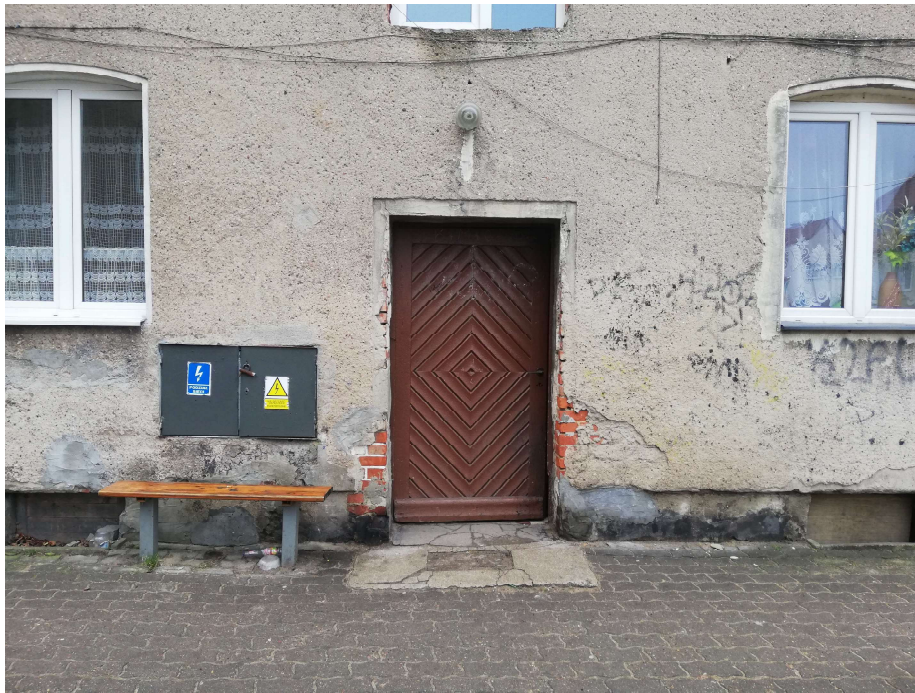
Zdj. nr 7 Drzwi od strony elewacji północnej odtworzyć wg rysunku historycznego